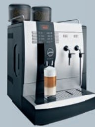
IMPRESSA X9 Platin