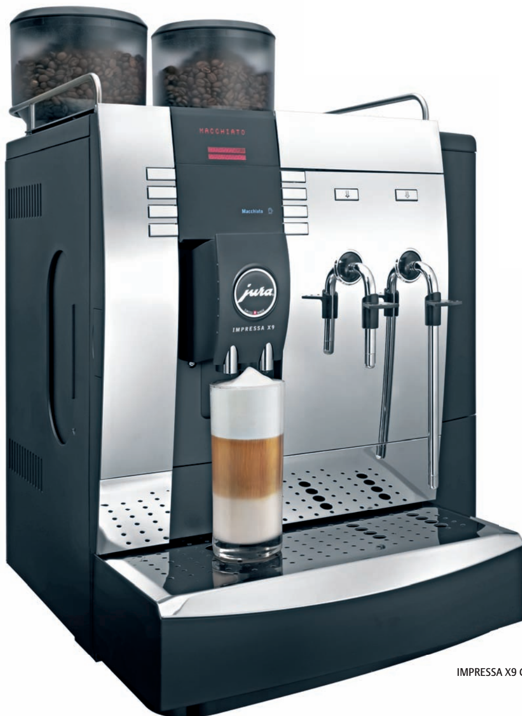
IMPRESSA X9 Chrom