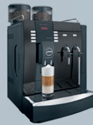
IMPRESSA X9 Pianoblack